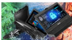
Mobilité Durcie & TEMPEST