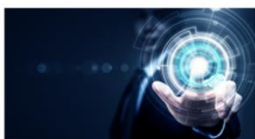
IHM & Electromécanique