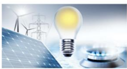
Puissance & Energie